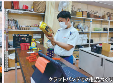
クラフトバンドでの製品づくり