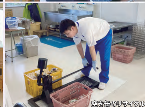
空き缶のリサイクル