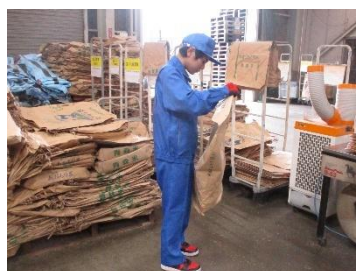
〔玄米袋畳み、玄米出し〕